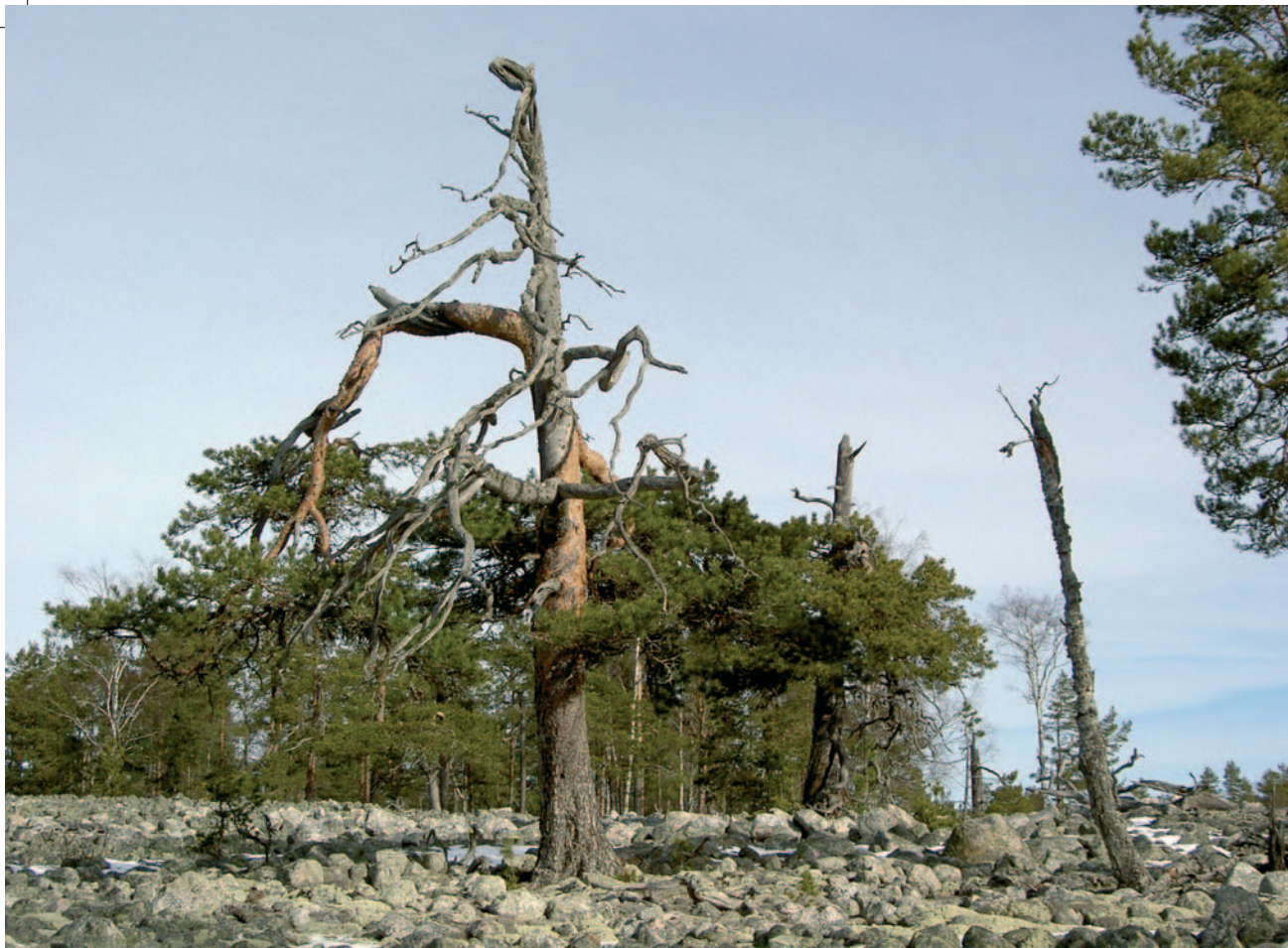
Något innanmurken, cirka 600-årig tall 1 km öster om Bredsandsmyran på klappersten. I bakgrunden till höger syns en annan 600-åring.

Both of these ca 600-year-old Pinus sylvestris trees were rotten inside.